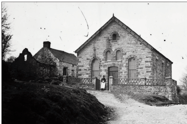
Capel y Groes, Llangwm, oddeutu 1875