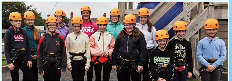
Ysgol Sul Glynarthen